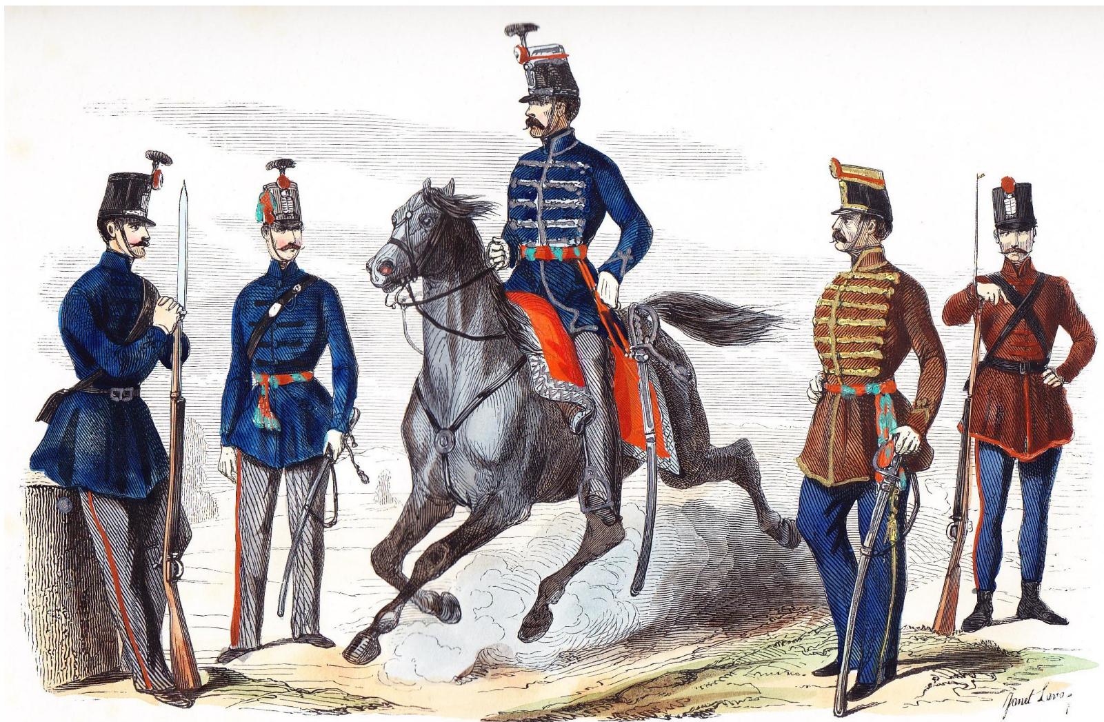
(Garde nationale à pied )